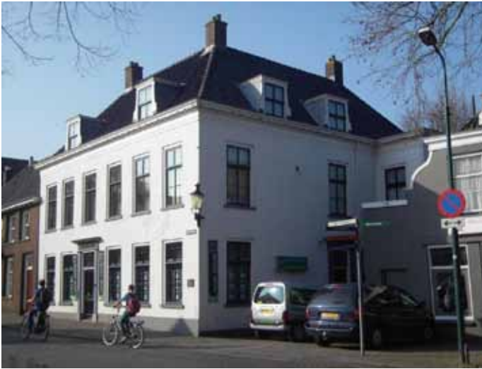
Foto: Het oude gemeentehuis aan de Dorpsstraat (momenteel 'Makelaershuis').

Op de open monumentendag zijn er activiteiten in diverse monumenten, zoals in Huize Harmelen, De Kievit, de Bavo kerk, tuinhuis 't Spijck bij huize Harmelen, het voormalig gemeentehuis aan de Dorpsstraat en het pand Breudijkermolen aan de Wildveldseweg op de locatie van de voormalige molen.