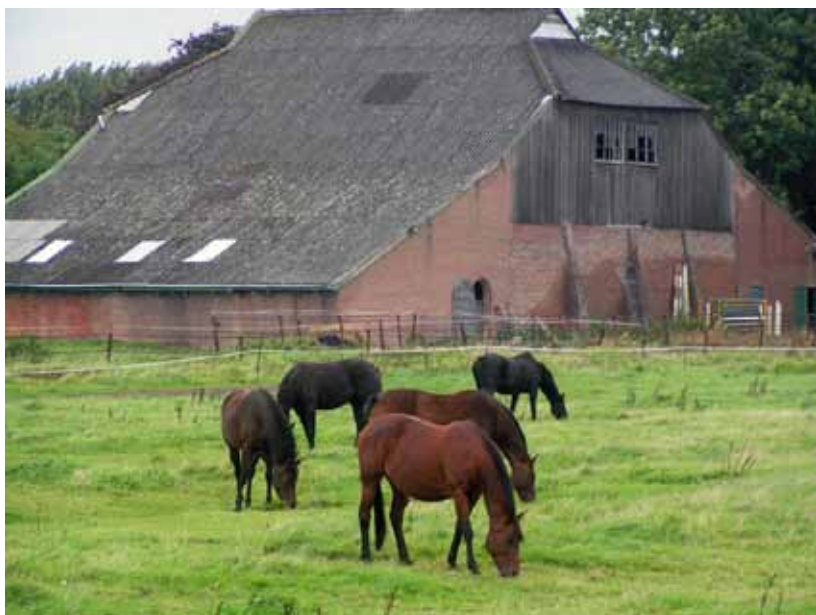
Boven de steenoverschuur op steenoverterrein IJsseloord en onder de constructie van de schuur